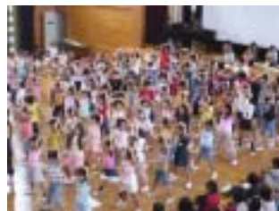
全校児童による平和集会

平和集会に向けて 校内平和集会に向け、各学年に戦争に関わる本を配布するとともに、全学級で「おりづるの旅」を担当や図書館員が読み聞かせをしました。6年生は「平和への伝言」の録音を聞き、調べ学習を進め、4年生は「さとうきび畑のうた」戦時中の暮らしまで学びました。 戦争に関わる本の貸し出しが増え、原爆、枯れ葉剤、地雷、貧困、ユニセフ、いじめ等、子どもたちの関心が多方面に広がり、学校全体で平和について考える機会となりました。