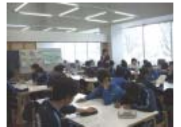
図書館オリエンテーション