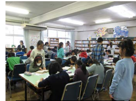
辞書引き大会の様子

市川小学校図書委員会では6月と11月に読書週間を実施しています。主な活動は読書郵便・読書貯金・読書ビンゴ・お薦め本の紹介・パネルシアター・辞書引き大会・お話し給食などです。特に辞書引き大会では、図書委員が問題を考えたり時間を計ったりして積極的に活動しています。