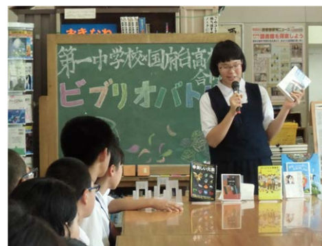
国府台高校との「ビブリオバトル」