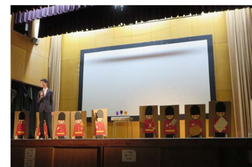
榎祭でのステージ発表