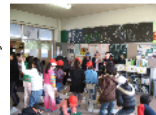
冬の図書室大集合！