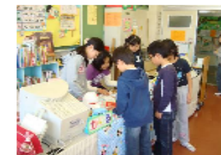
休み時間に新しいカウンターで