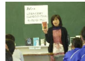
本との豊かな出会い

本校では、「朝の読書の時間」に毎年地域の方に、読み聞かせをしていただいています。1学期には、3年生を対象に『そこに僕はいた』の1章を読んでいただきました。2学期の読書週間期間では、2年生を対象に絵本『ともだち』を読んでいただきました。読書の好きな生徒はもちろんですが、読書に関心の薄い生徒もいつのまにか姿勢を正し、真剣に聞き入っていました。