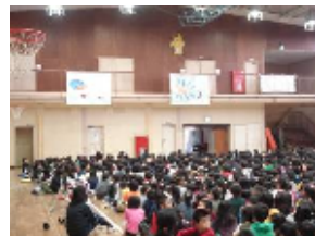
委員会による昔話発表

本校では、「朝の読書の時間」に毎年地域の方に、読み聞かせをしていただいています。1学期には、3年生を対象に『そこに僕はいた』の1章を読んでいただきました。2学期の読書週間期間では、2年生を対象に絵本『ともだち』を読んでいただきました。読書の好きな生徒はもちろんですが、読書に関心の薄い生徒もいつのまにか姿勢を正し、真剣に聞き入っていました。