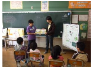
図書委員会の読み聞かせ