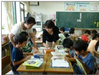
担任と学校司書のTTで行う

今後の協力校の公開授業は、第七中学校10月29日、新井小学校12月3日の予定です。多くの教職員の方々のご参加をお待ちしております。