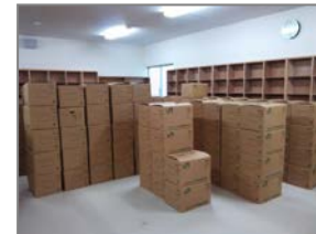
引っ越し前の段ボールの山

多くの子どもたちが、勉強に読書にと新しい図書館へ足を運んでくれることと思います。