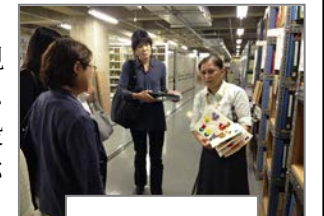
バックヤード見学

毎月、研修を行い授業支援のためのスキルの向上を図っています。新規採用者には、通常の研修会の他に、中央図書館の見学や相互貸借システムについての説明会も行います。今年も、中央図書館の司書の案内で、普段は見られないバックヤードに入り、どのような手順で中央図書館の図書が学校に届くのか等について説明を受けました。