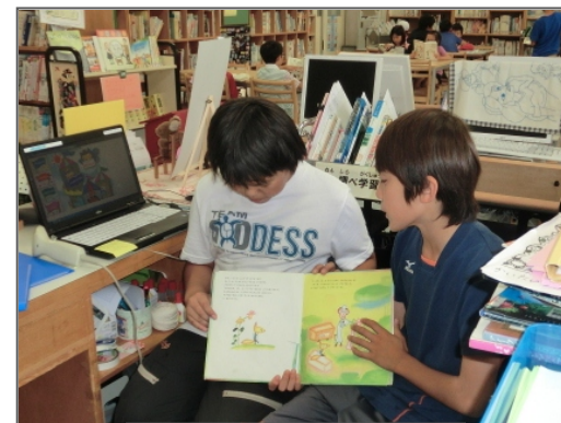
読み聞かせの練習風景