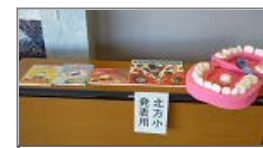
参考図書&手作り資料