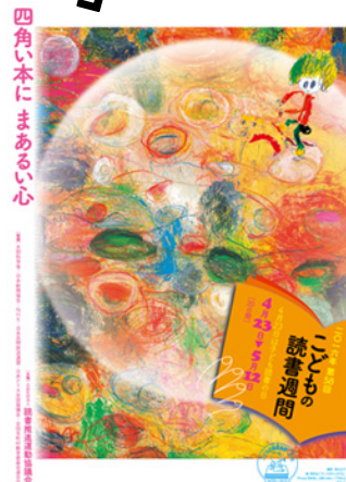
四角い本に まあるい心

この標語のように私たち大人も、まんまるな心になれる読書の時間を少しでも持つことができると素敵です。